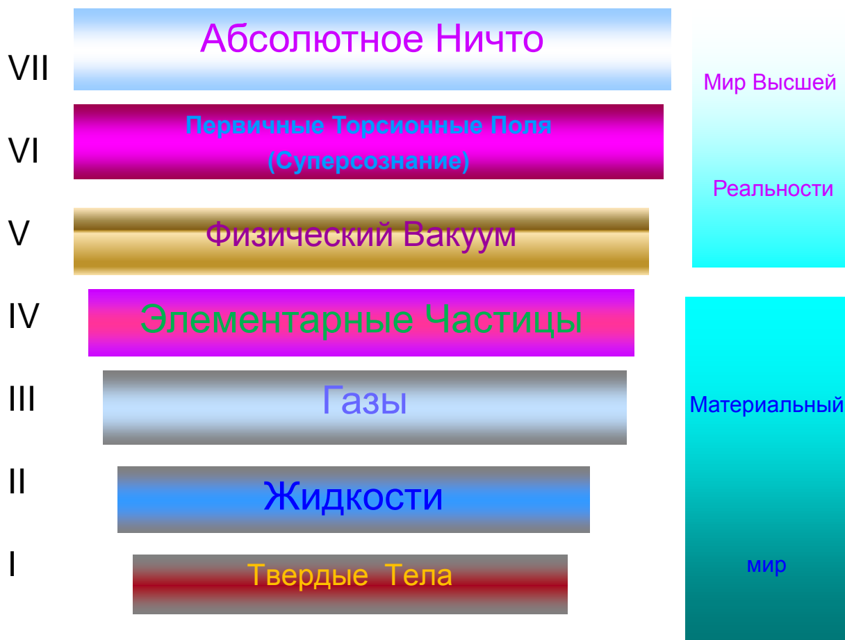
Рис1. Семь Уровней Реальности в Теории Физического Вакуума